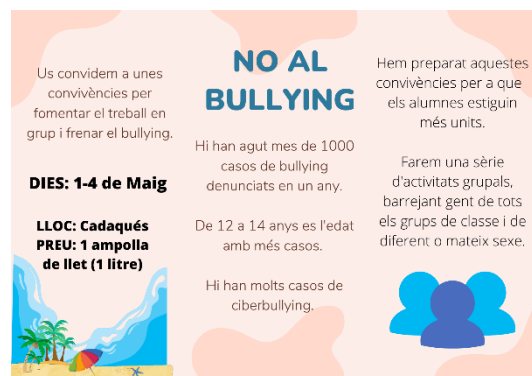
Tríptic informatiu sobre unes activitats a realitzar a les colònies sobre assetjament.