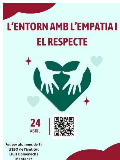
Cartell sobre una activitat relacionada amb l'empatia i el respecte